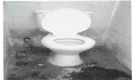
Foto 6: Mantenimiento de servicios sanitarios, limpieza y cambio de accesorios.

Observación: Si es necesario se pueden agregar hojas adicionales y actualizar el número de hojas.